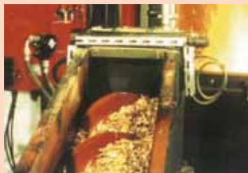
ALIMENTATION DE LA CHAUDIÈRE