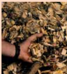
COPEAUX DE BOIS